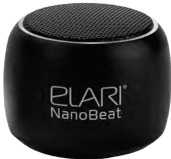
Diagrama si specificatii