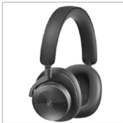
Figure 1: Example photo, colours may vary

Equipment: Bluetooth Headphone Brand: Bang & Olufsen Model name: Beoplay H95 Object of equipment: